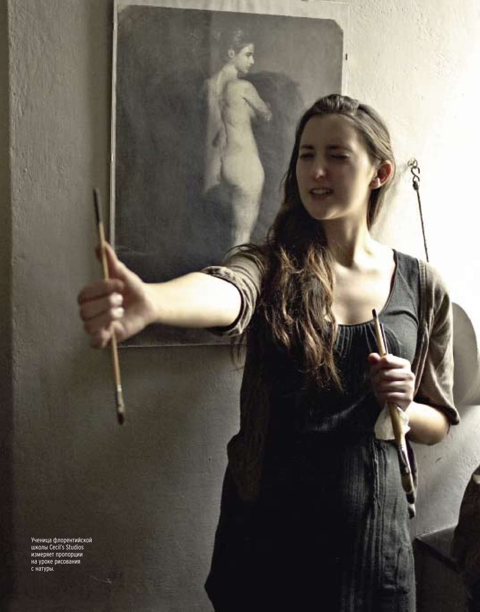
Ученица флорентийской школы Cecil's Studios измеряет пропорции на уроке рисования с натуры.